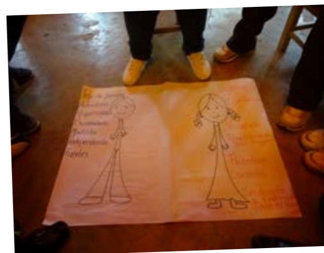
SEKSUELLE RETTIGHEDER PÅ 13. ÅR I BOLIVIA

AXIS har i mange år arbejdet med dialogbaseret seksualundervisning i Bolivia. Nu har 18 kommuner afsat midler til at sikre dialogbaseret seksualundervisning til kommunernes unge, og regeringen har anmodet om at integrere de materialer, vi har udviklet i samarbejde med Pueblo Diferente, på alle statens læreruddannelser. Projektet har dannet grundlag for AXIS' øvrige seksualundervisningsprojekter i Peru, Ghana og Sierra Leone.