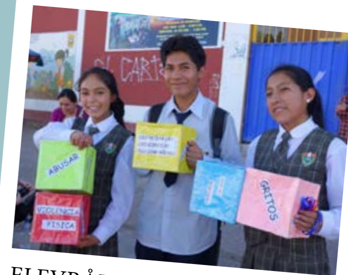
ELEVRÅD I AYACUCHO, PERU

AXIS støtter fælleselevrådet AARLE, som styrker unges demokratiske deltagelse i syv provinser i Ayacucho. AARLE har opnået stor anerkendelse, ikke blot af unge i regionen, men også af det regionale undervisningsministerium. AARLEs pres på myndighederne har resulteret i, at de nu finansierer elevrådets årlige konferencer, hvor 400 unge og 90 kontaktlærere fra næsten 100 skoler i regionen diskuterer og planlægger emner vedrørende unges rettigheder. Erfaringerne med at organisere unge og at styrke deres rettigheder skal nu indarbejdes i læreruddannelsen.