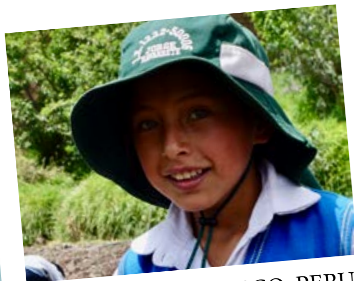
SKOLEHAVER I CUSCO, PERU

I samarbejde med lærere, elever og forældre på 25 skoler har AXIS udviklet praktisk undervisning baseret på lokale traditioner i Cusco-provinsen. I skolehaverne lærer børnene at dyrke grøntsager, men haverne danner også ramme for klassiske fag, der normalvis foregår i klasseværelser. Flere af skolerne er blevet præmieret som de bedste i landet, og elevernes selvværd og faglige kompetencer er forbedret. Nu er de lokale og regionale myndigheder ved at overtage ansvaret for at udbrede modellen til flere skoler.