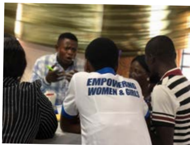
SEKSUALUNDERVISNING I SIERRA LEONE

Siden 2014 har AXIS arbejdet for at styrke unges viden om og aktive brug af seksuelle og reproduktive rettigheder i syv regioner i Sierra Leone. Igennem samarbejde med centrale civilsamfundsorganisationer er der blevet lagt massivt pres på de nationale myndigheder. Det har resulteret i, at myndighederne samarbejder med vores partner, CARL, om at støtte den videre udvikling af projektet. Desuden begynder skoler nu selv at udvikle og validere pædagogisk materiale inden for seksualundervisning.