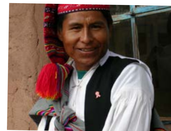
RETTIGHEDER OG LOKALTURISME

På Taquile i Titicacasøen, Peru, har øens oprindelige befolkning i mange år kæmpet for at fastholde kontrollen over den voksende turisme. Som den eneste NGO samarbejder AXIS med øens ledelse om at styrke organiseringen af turismen. Nu har øen eget turistbureau og en lånekasse, der låner befolkningen penge til projekter, der gavner lokal turisme.