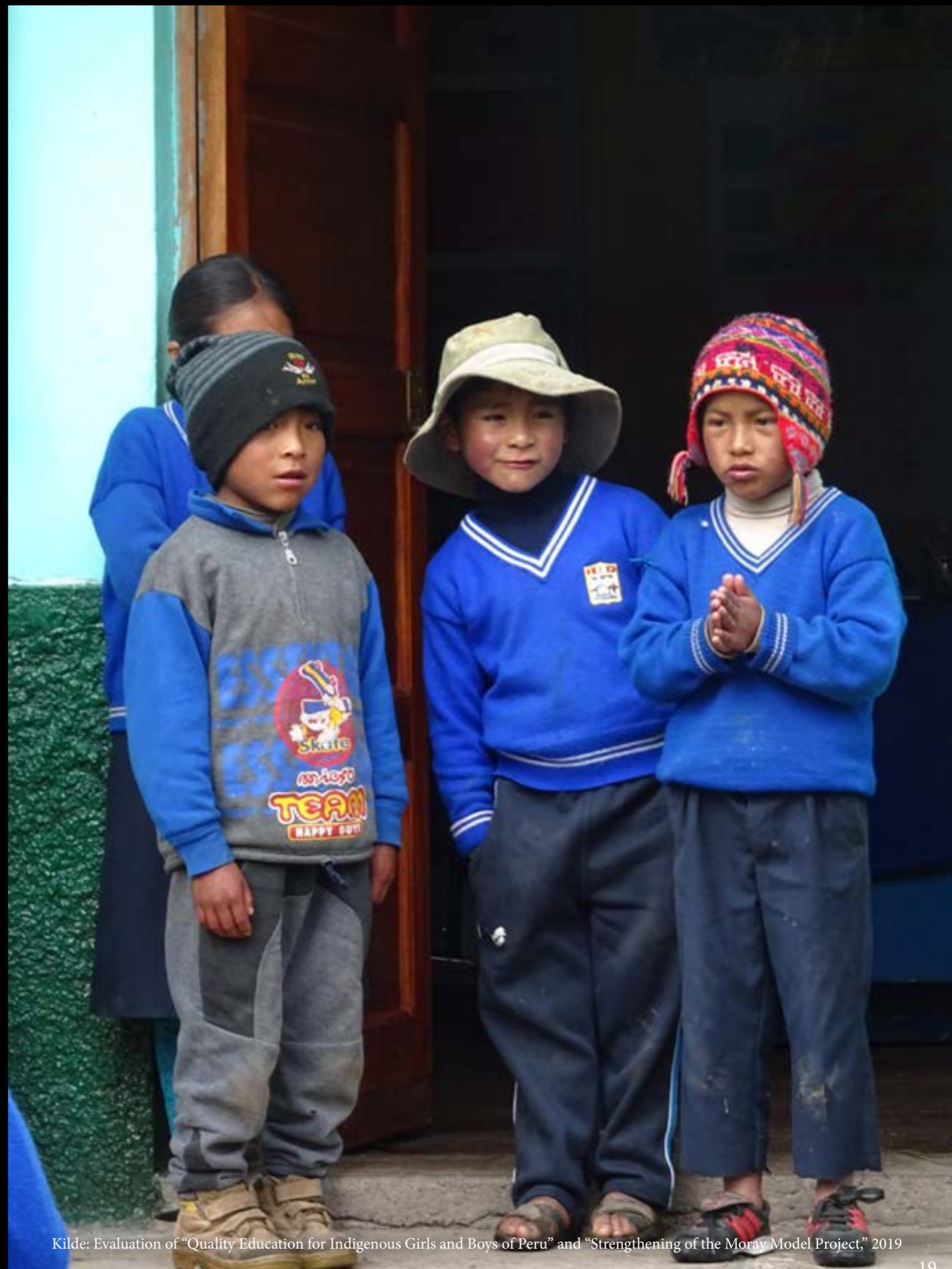
Kilde: Evaluation of “Quality Education for Indigenous Girls and Boys of Peru” and “Strengthening of the Moray Model Project,” 2019

3500 elever har modtaget kvalitetsuddannelse med udgangspunkt i deres sprog og kultur og fået bedre læse- og regnefærdigheder, men er også blevet mere bevidste om deres kultur. Det er ambitionen med projektet, som fortsætter ind i det nye årti, at skolerne ikke længere er isolerede institutioner, men bliver relevante for det lokale liv, og at børnene får de nødvendige redskaber til et fremtidigt liv som aktive og kritiske medborgere.