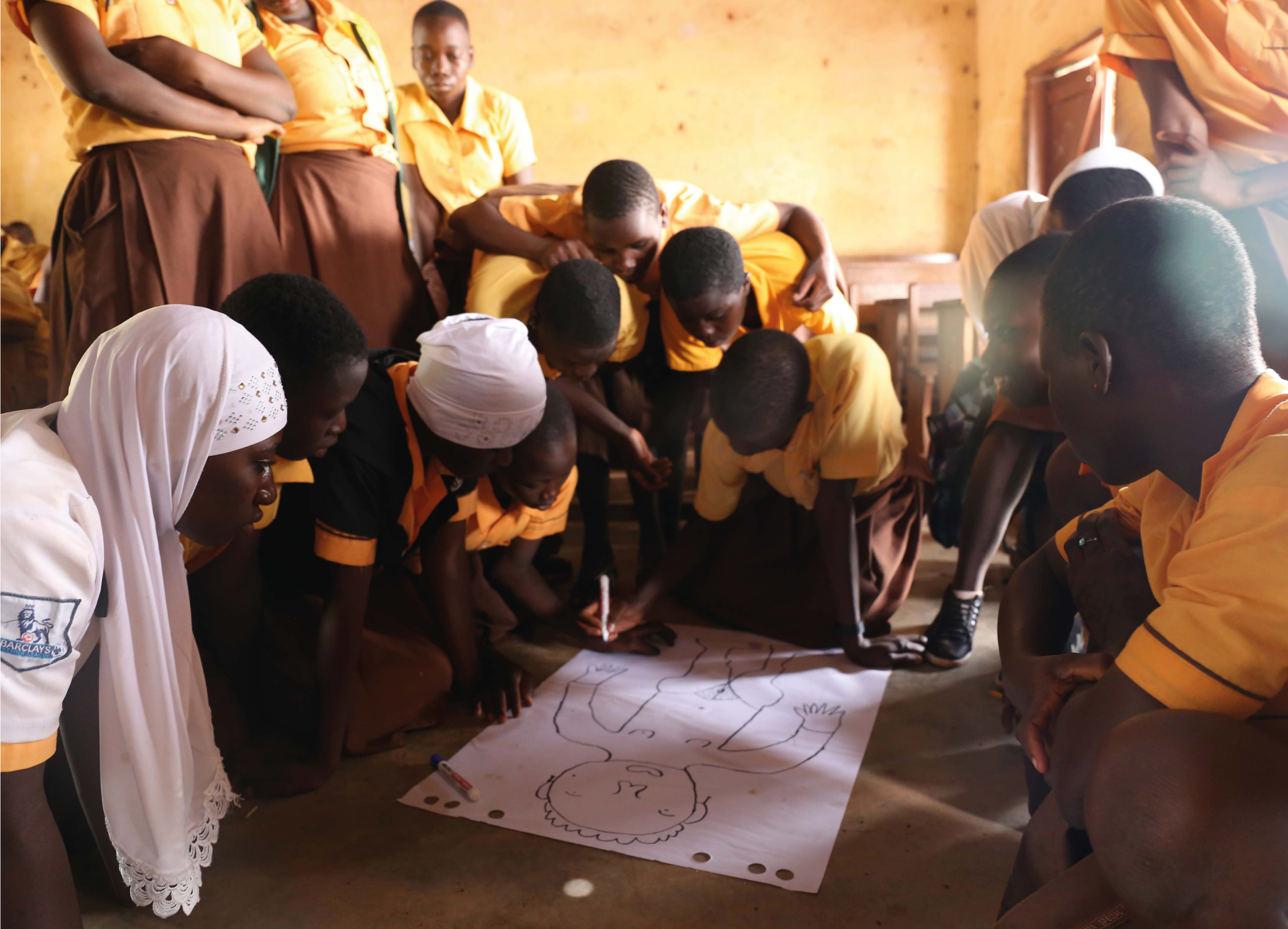
Moglaa Junior High School, Savelugu, Ghana